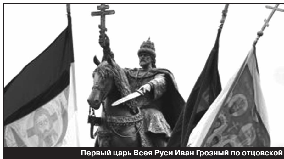
Первый царь Всея Руси Иван Грозный по отцовской линии Рюрикович, по материнской – от Мамая

В толковании каббалистов, по «Законам и пророкам», концу века сего и антропологическому повороту середины XXI века к «новому небу и новой земле, на которых обитает правда» пред-